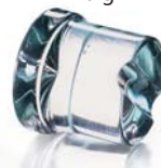
Ø 29 x H 34 mm