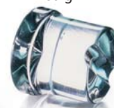
Ø 38 x H 41 mm