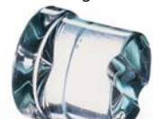
大号圆冰 39 g