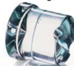
中号圆冰 20 g