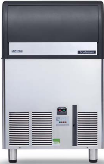
喷淋部件简便拆卸