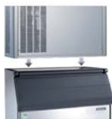
NB 393 NB 530