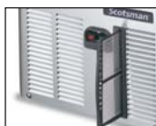
可拆卸的冷凝器滤网