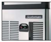
正面开/关按钮 故障报警功能