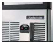
正面开/关按钮 故障报警功能