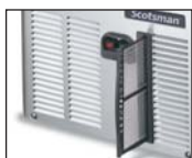
可拆卸的冷凝器滤网